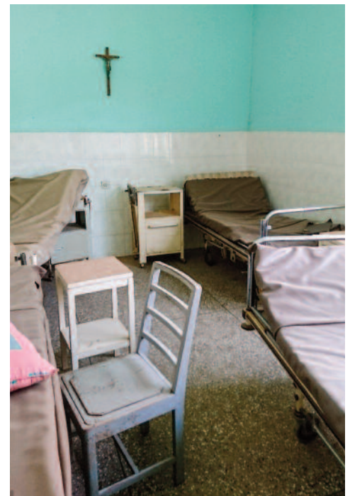
▲ Hier entsteht die neue Palliativstation von Akwatia.