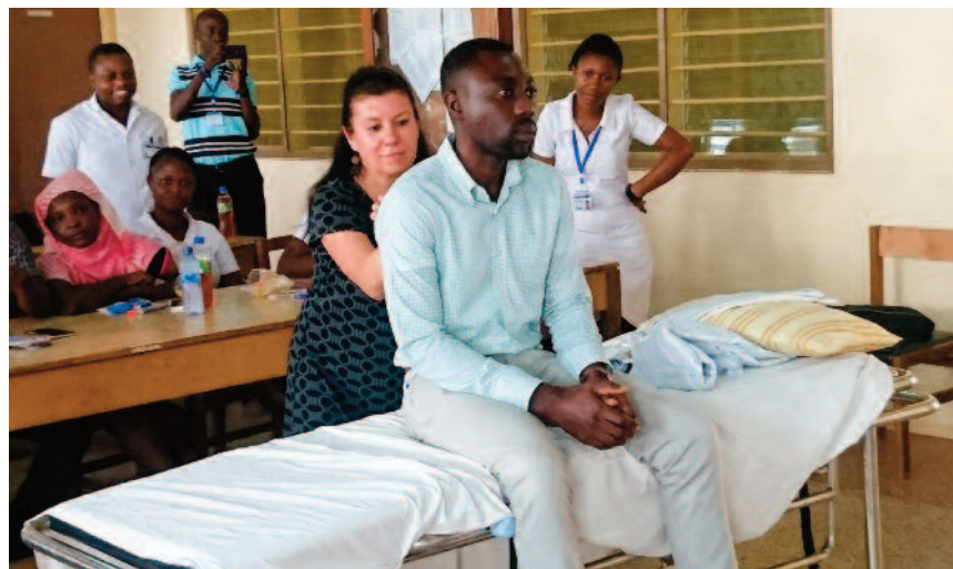
▲ Praktische Beispiele ergänzten den Unterricht.