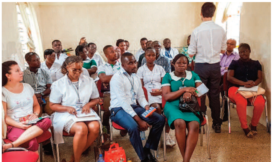
▲ Auch in Akwatia waren die Zuhörer äußerst motiviert.