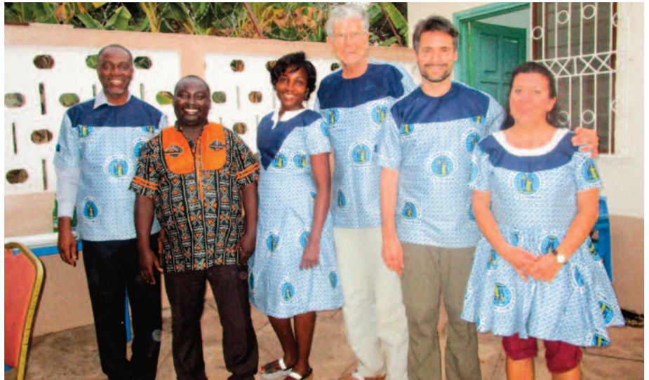
▲ Zum Abschied in Techiman: Das Unterrichtsteam in landestypischen Kleidern

In dem Blog „16 Tage Ghana – Palliativmedizin an der Goldküste“ ( https://16tageghana.wordpress.com ) finden Sie den Aufenthalt detailliert dokumentiert.